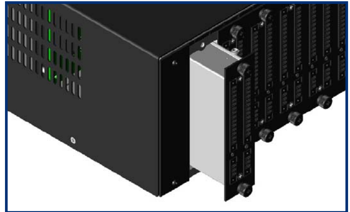
Vista de los módulos complementarios del ZPU-5000