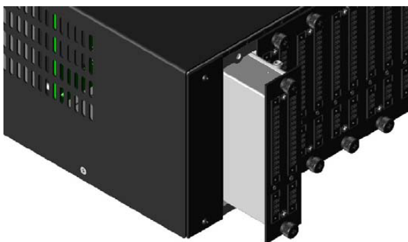
Vue des modules enchâssables ZPU-5000